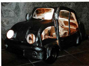
LIVING CAR - 2003 materiali vari cm 68 x 38 x 39