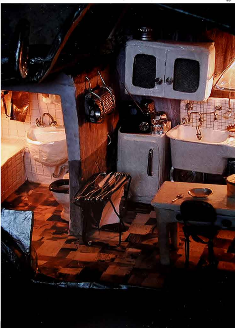
LIVING CAR - 2003 materiali vari (particolare dell'interno)